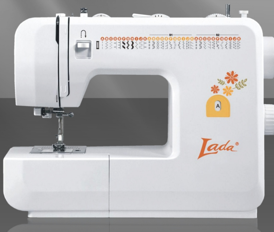
Přídatný stolek *